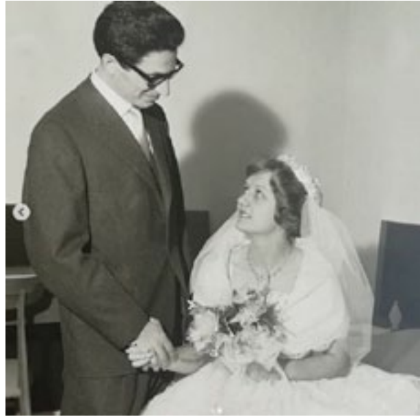
Da @fabio stefano13361