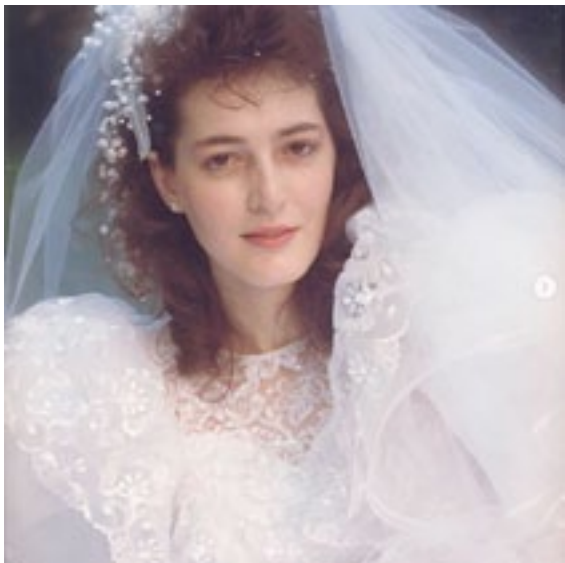
Da Sara Valcamonica