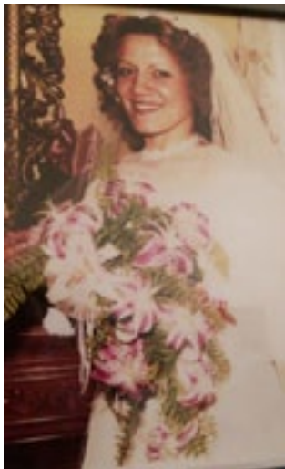
Da Massimo Fatiga