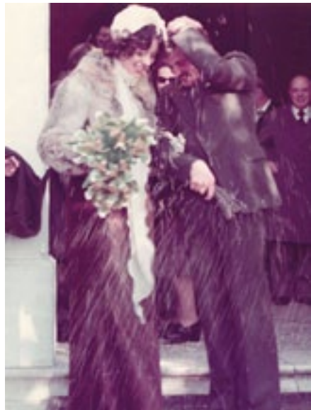
Da Francesco Deponti