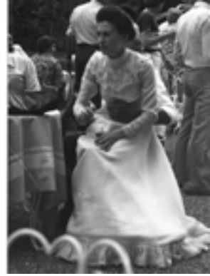
Da Francesco Deponti